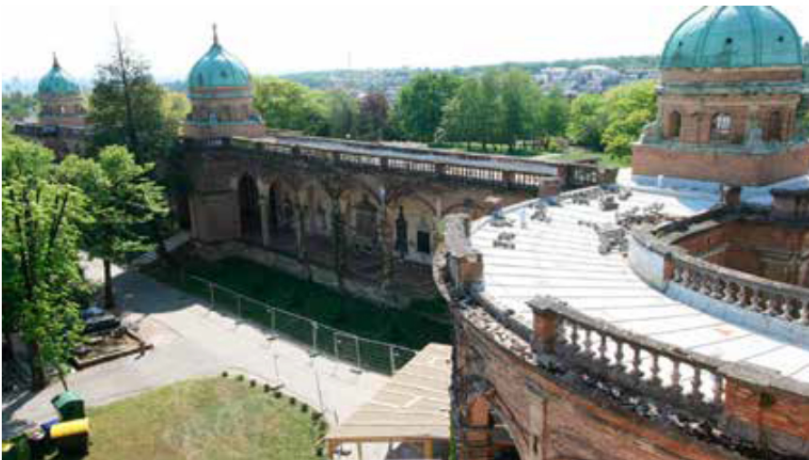
Pogled na urušeni zabat i napknuće stupa malih arkada (gore) i urušenu balustradu južnih arkada (dolje)