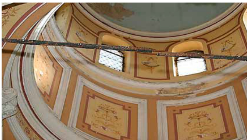
Pogled na oštećenja svodova i lukova malih i velikih arkada (gore) i puknuće zatege južnih arkada (dolje)